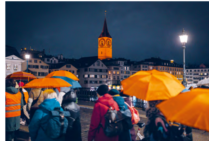
Orange als Warnfarbe: Die Kirche St. Peter setzte ein Zeichen zum Internationalen Tag gegen Gewalt an Frauen.