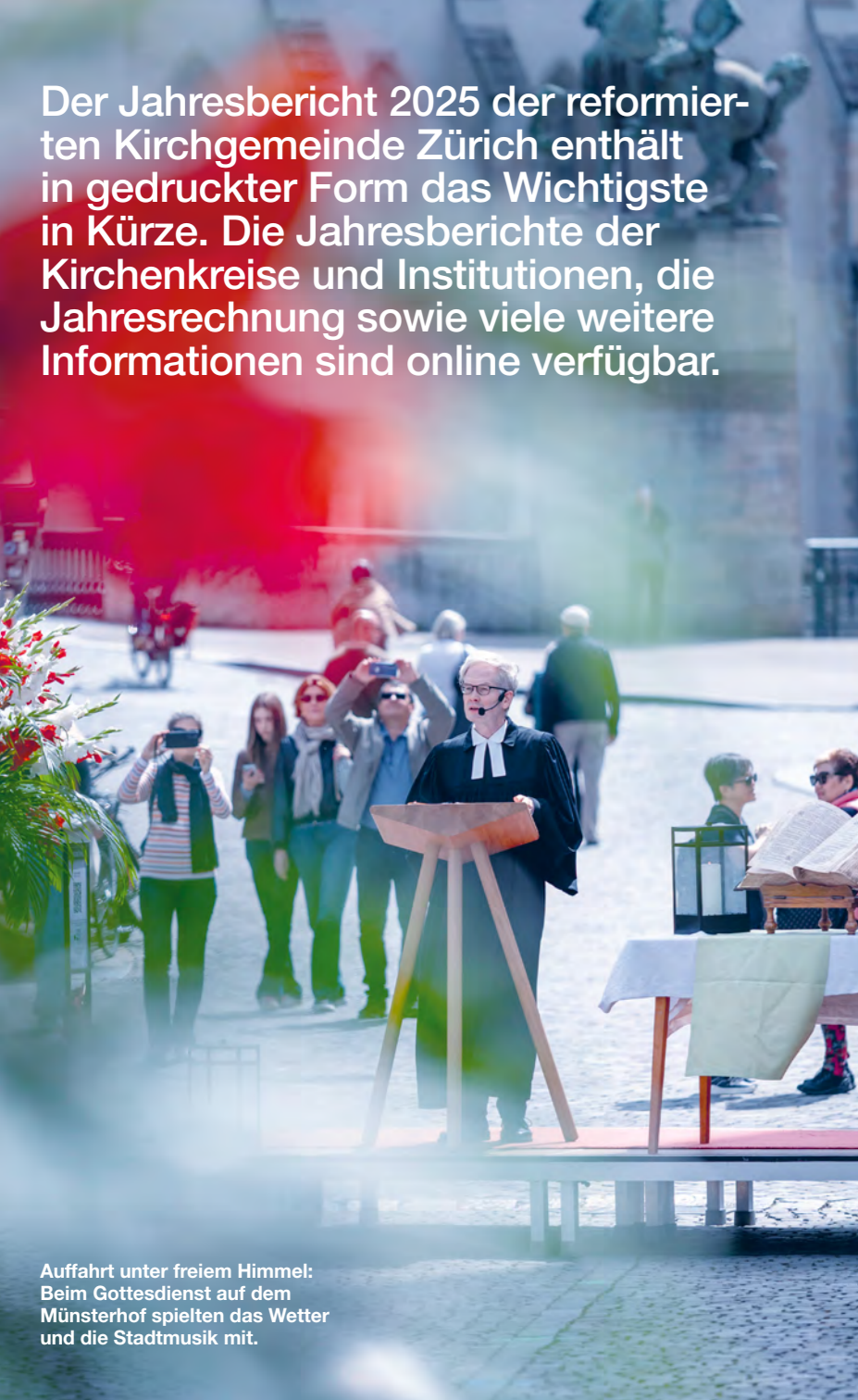
Auffahrt unter freiem Himmel: Beim Gottesdienst auf dem Münsterhof spielten das Wetter und die Stadtmusik mit.

Der Jahresbericht 2025 der reformierten Kirchgemeinde Zürich enthält in gedruckter Form das Wichtigste in Kürze. Die Jahresberichte der Kirchenkreise und Institutionen, die Jahresrechnung sowie viele weitere Informationen sind online verfügbar.