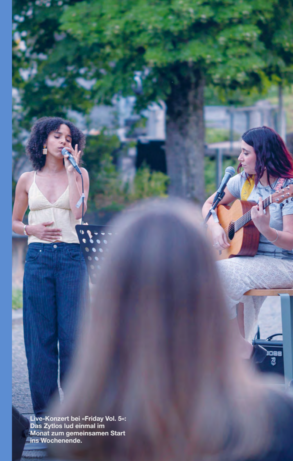
Live-Konzert bei «Friday Vol. 5»: Das Zytlos lud einmal im Monat zum gemeinsamen Start ins Wochenende.

Taufen, Konfirmationen, Trauungen und Bestattungen