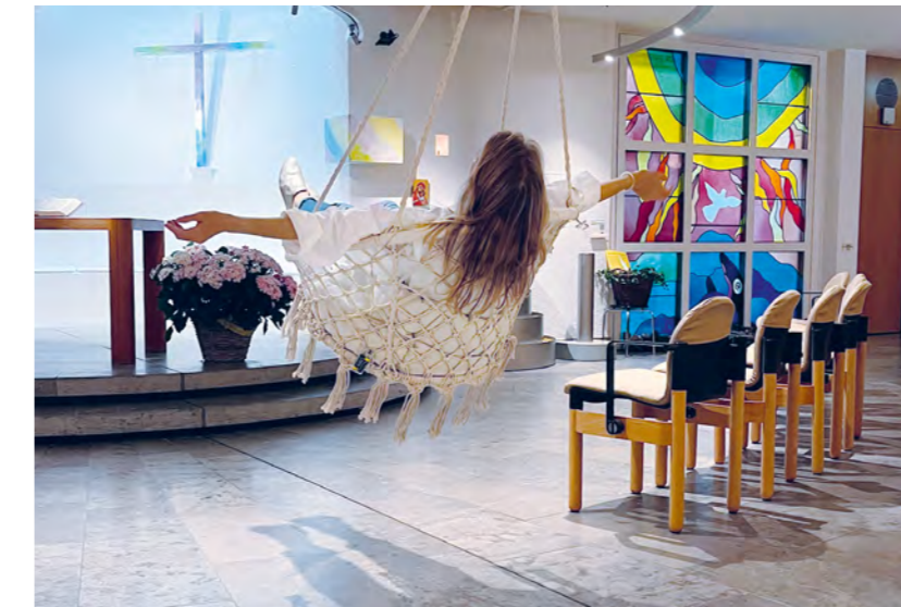
«Himmelschaukel» in der Spitalkirche: Das Seelsorgeteam des Universitätsspitals ist rund um die Uhr erreichbar.