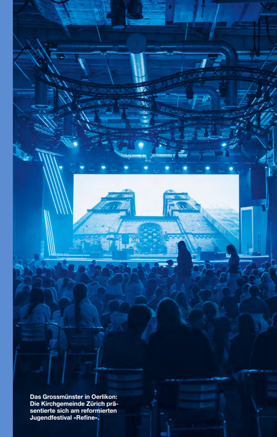
Das Grossmünster in Oerlikon: Die Kirchgemeinde Zürich präsentierte sich am reformierten Jugendfestival «Refine».

Freiwilligen in der kirchlichen Arbeit unterstützt